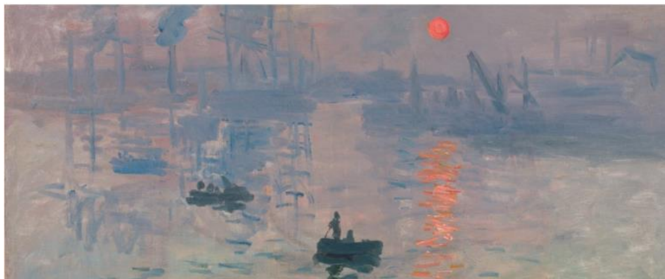
Claude Monet (1840-1926)