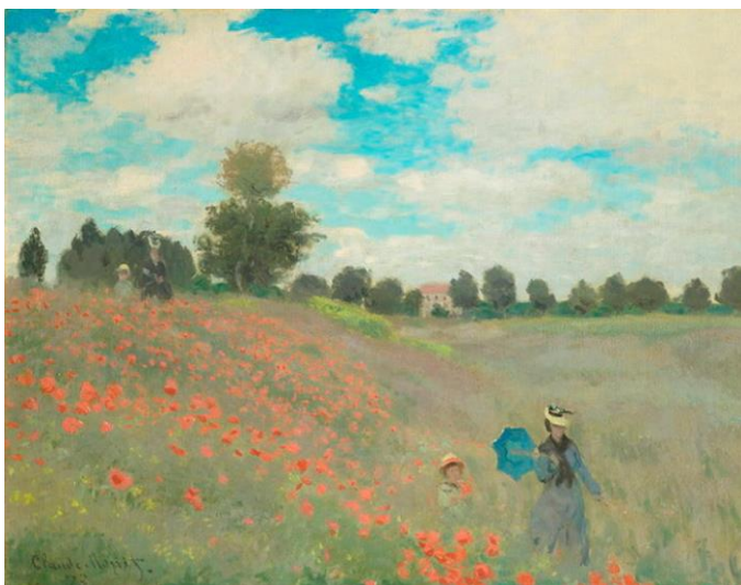
O lume nouă. Macii, de Claude Monet, ulei pe pânză (1873).