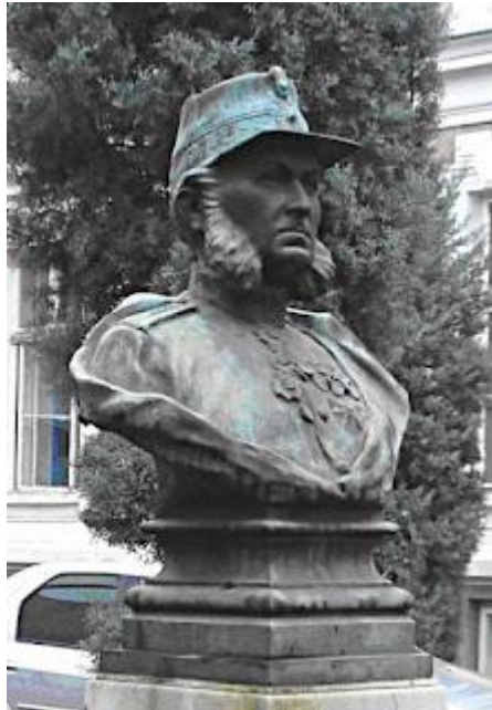
Bustul generalului Carol Davila