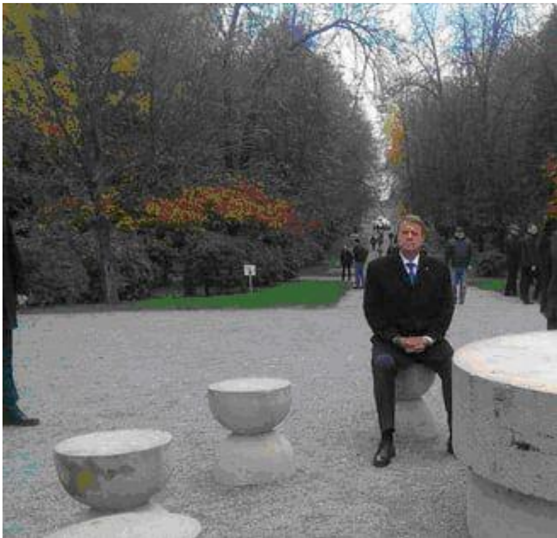
Tăcut la masa tăcerii