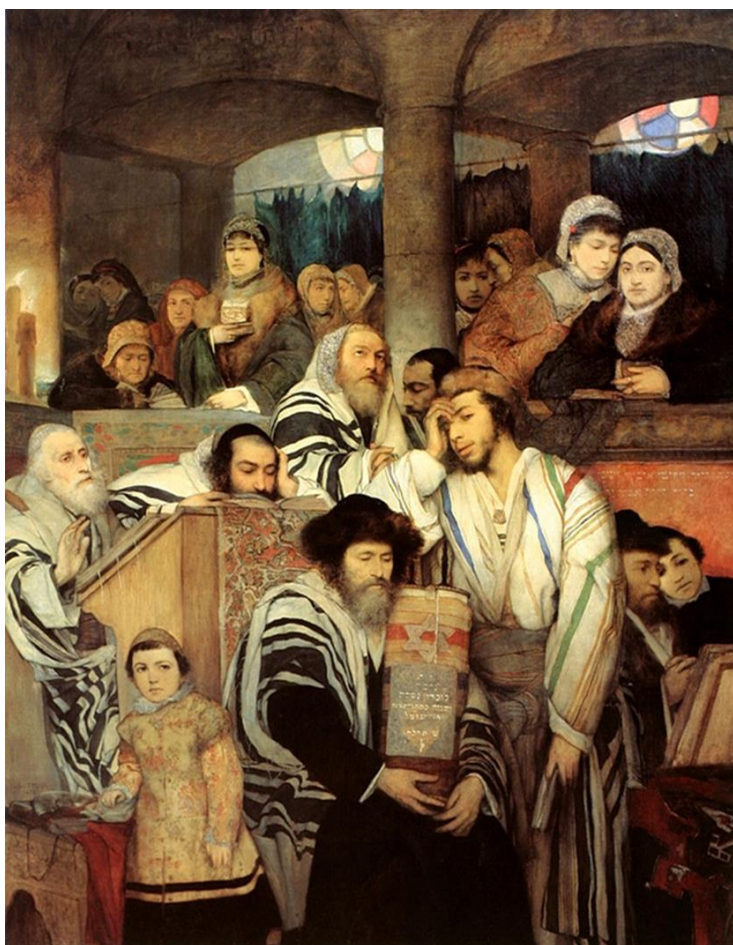
Maurizi Gottlieb, "Jews Praying in the Synagogue on Yom Kippur", 1878, oil on canvas, 245x192 cm.

“Cât aș vrea să elimin toate prejudecățile împotriva bieților mei coreligionari! Cât aș vrea să extirpez ura acestui sărac popor! Cum mi-aș dori să aduc reconcilierea polonezilor și evreilor, căci istoria ambilor este o istorie a suferinței. Adevărat, este presuntuos din partea mea să cred că sunt chemat să fiu un astfel de apostol. Dacă îmi lipsește puterea de a atinge scopul final, fie ca simpatia pe care compatrioții mei o au față de mine și relatările personalității mele din presa poloneză să demonstreze că, cel puțin, sunt pe calea cea bună către realizarea lui”.