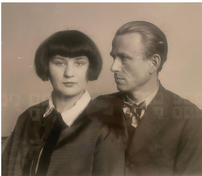
August Sander, "The Painter Otto Dix and His Wife Martha" (1925)

O expoziție de la Copenhaga oferă o perspectivă bogată asupra producției creative și a vieții cotidiene din Republica de la Weimar, cu farmecul și grotescul ei.