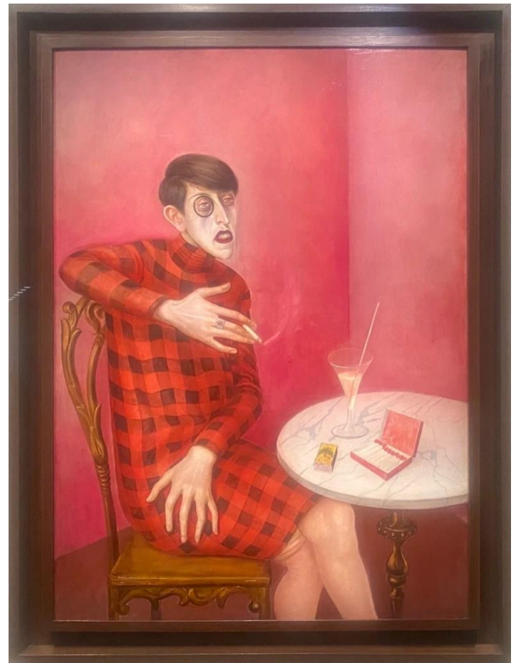
Otto Dix- jurnalista Sylvia von Harden" (1926)

"Noua obiectivitate", notează textul expoziției, "este mai puțin o mișcare clar definită, cât un nou mod de a privi lumea cu o privire rece și exigentă. Într-o societate marcată de convulsii violente, artiștii mișcării se străduiesc să surprindă viața cotidiană modernă, reprezentând viața de zi cu zi a oamenilor obișnuiți într-un stil realist, sobru și adesea lipsit de sentimente."