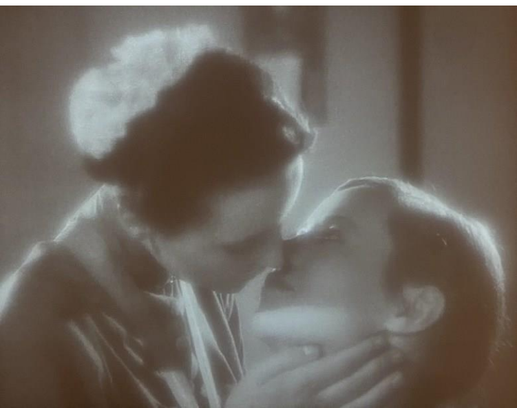
Carl Froelich, Leontine Sagan, still from Girls in Uniform (1931)

Acest din urmă obiectiv reușește să fie cuprinzător, prezentând o gamă uimitoare de oameni în mod egal - versiunea secolului XX a cutiilor Zoom dimensionate la fel atât pentru patroni, cât și pentru muncitori. Dar proiectul nu reușește să ofere demnitate persoanelor în vârstă și persoanelor cu dizabilități într-o secțiune pe care Sander o intitulează Ultimii oameni (chiar și textul expoziției subliniază că titlul și poziționarea "rămân tulburătoare").