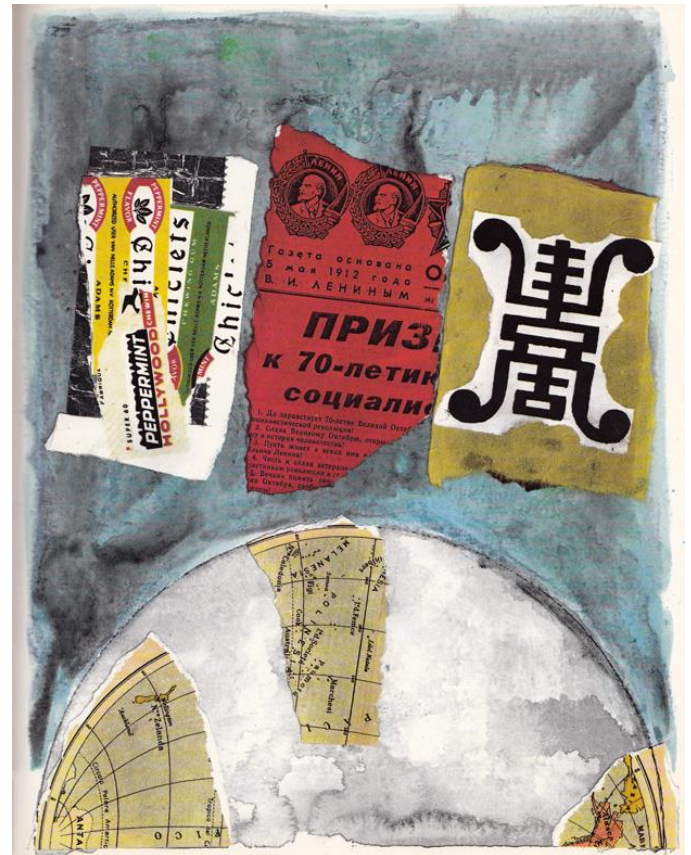
Art by Eugenio Carmi from The Three Astronauts , Umberto Eco's vintage semiotic children's book about world peace

Cu un deceniu înainte de a întinde o mână caldă dincolo de Cortina de Fier a Războiului Rece în frumoasa sa scrisoare de solidaritate interculturală către Boris Pasternak, Camus scrie: