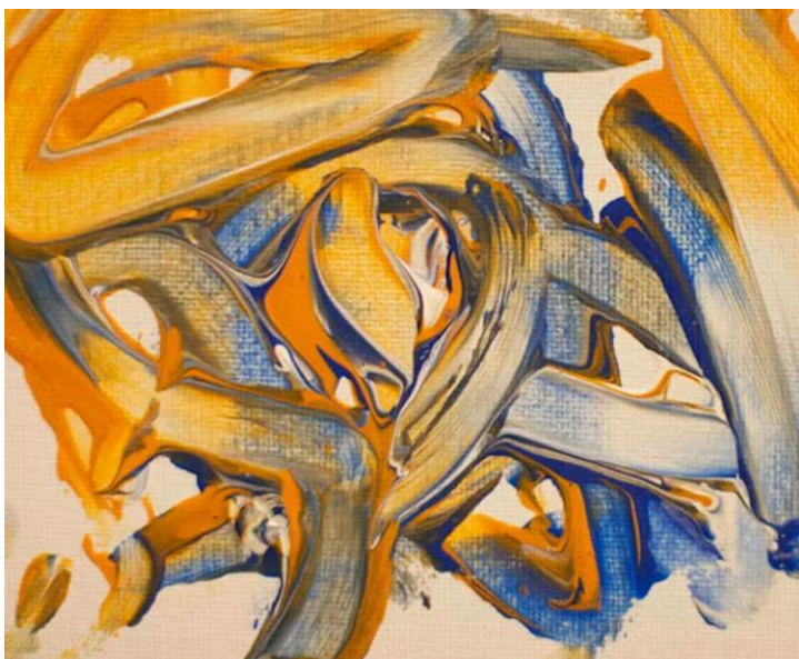
Jigit Master by Bakhari, a chimp at Saint Louis Zoo.

Modul în care pare să apară creativitatea, de obicei spontan și fără ca noi să provocăm în mod conștient aceasta este descrisă de Andreassen N.C. (2011). Acest proces este, de asemenea, descris în unele lucrări de specialitate (Gleitman, Fridlung & Reisberg, 2014a) drept incubare inconștientă. Modul subconștient în care apare fenomenul sugerează că va exista un mecanism biologic care să conducă procesul.