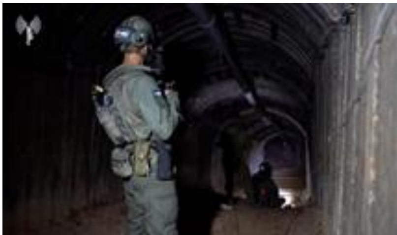
Un tunel mare găsit și investigat de către IDF

Luptele din Gaza au fost intense în majoritatea zilelor de la ultima actualizare, dar această intensitate a scăzut treptat în ultimele două zile. Evaluarea este că majoritatea teroriștilor din cartierele de est ale orașului Gaza fie au fost uciși, s-au predat, fie au fugit. Luptele actuale ale Hamas sunt mai degrabă în stil de gherilă (lovituri sporadice de lovitură și fugă) decât încercări de a menține terenul. Cu toate acestea, în Khan Yunis, luptele continuă să fie intense. În ultimele 11 zile, 40 de soldați israelieni au fost uciși, ceea ce duce la aproximativ 155 de soldați israelieni uciși în Gaza. Au fost descoperite și cadavrele a șapte persoane răpite de Hamas la 7 octombrie (atât soldați, cât și civili), cinci dintre ei într-un tunel investigat de unitățile de ingineri ale IDF.