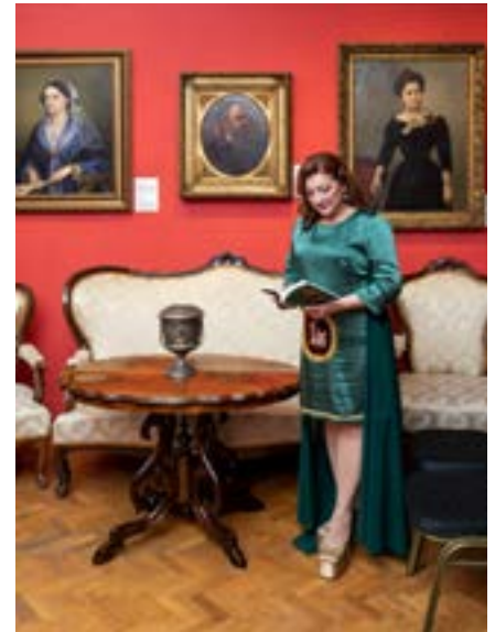
Foto lansare carte