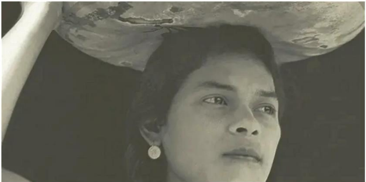
Femme de Tehuantepec (1929)

Fotografiile realizate de Tina Modotti îmbină rigoarea formală cu conștiința socială. Artista de origine italiană a emigrat în Statele Unite când avea 16 ani. A jucat în piese de teatru și filme mute și a lucrat ca model pentru artiști în primii ani petrecuți în țară. În 1920 l-a întâlnit pe fotograful Edward Weston, care i-a fost mentor și a avut o mare influență asupra lucrărilor sale ulterioare. Până în 1921 au devenit iubiți, iar în 1923 s-au mutat împreună în Mexico City, care devenise un centru cosmopolit în perioada interbelică. Acolo, expatriați culturali și politici precum Weston și Modotti, Serghei Eisenstein și Leon Troțki s-au mutat în cercuri boeme cu intelectuali și artiști mexicani precum Frida Kahlo și Diego Rivera . Modotti și Weston au deschis un studio de portrete în oraș.