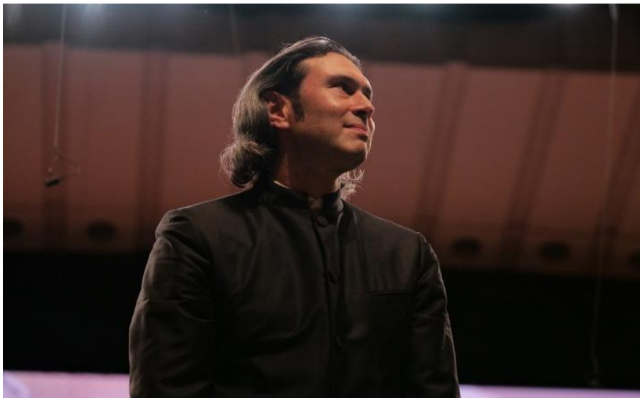
Vladimir Jurowski la finalul unui concert de la Enescu 2019