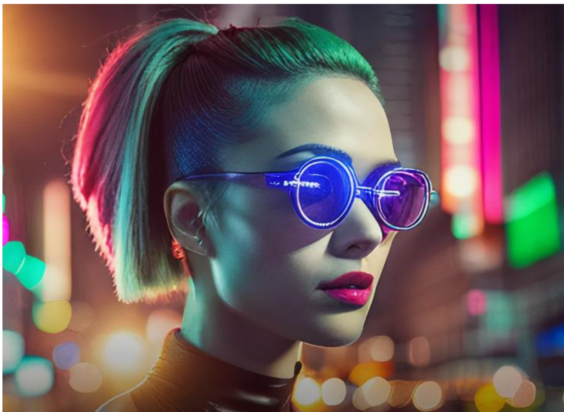
Ilustrație- Stable difussion XL