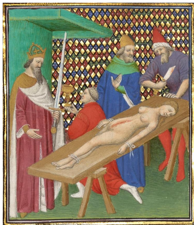
Nero asistă la mutilarea Agrippinei, ulei anul 1413.

Atent la conjunctura crucială a omorului, Nero îl obligă pe Otho, soțul încornorat al Popei (viitoare soție a lui Nero) să organizeze un alibi, un banchet la care cei doi apar într-o forțată vervă. Dio ne spune că însuși Nero nu era capabil să accepte vestea, enormitatea crimei comisă îl duce la respingerea ei, ca și cum nu ar fi fost posibilă. Desigur este pură actorie, el era perfect la curent cu cele petrecute, ba chiar insistă să vadă corpul decedatei. După o minuțioasă și nefirească inspecție Nero exclamă că nu avea idee cât de frumoasă fusese Agrippina.