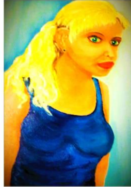
"Woman in blue" , oil on canvas, 80/60cm