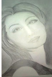
"Young woman" black pencil drawing , on Steinbach paper 46/36cm