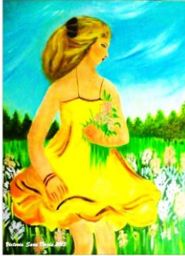
"Wild field 2" , oil on canvas, 80/60cm