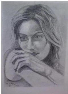
"Woman's eyes"-black pencil drawing on Steinbach paper 46/36cm.