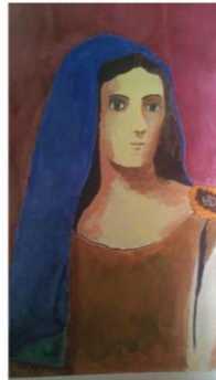
"Blue Veil" , aquarelle on Saunders Waterford, 46/33cm , inspired by Pablo Picasso