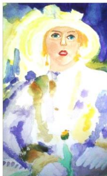
" White gloves " , aquarelle on Saunders paper, 53/35cm