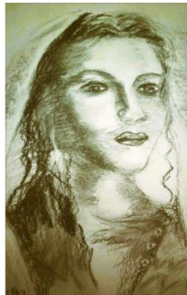
"Woman portrait" , carbon drawing on Steinbach paper, 46/37cm.