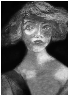
"Norma Shearer, 1920". Carbon drawing on Steinbach paper, 70/50 cm