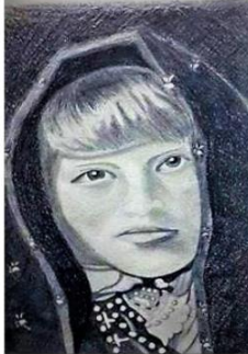
"Acoma Pueblo"- American native black pencil drawing , on Steinbach paper 46/36cm