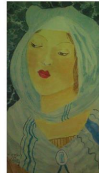
"Astronomia" ,Aquarelle on Saunders paper 47/33cm , inspired by Sandro Boticelli "