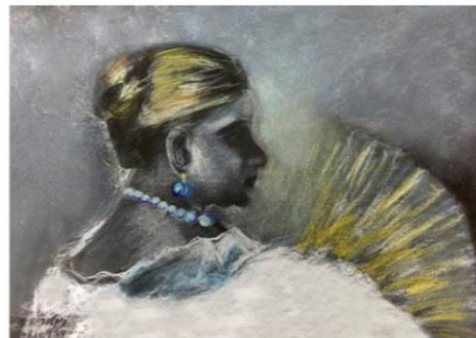
• "Woman with fan" , color chalk on black Canson paper,50/30cm.