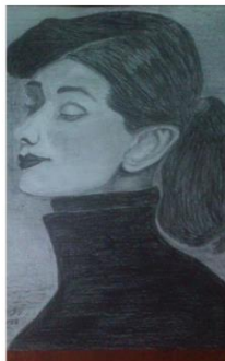
"Audrey Heburn ", black pencil drawing on Steinbach paper ,50/35cm