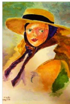
"Young American woman" portrait , aquarelle on Saunders Waterford, 46/33cm