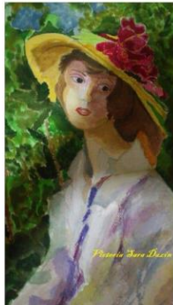
"Woman in summer" , aquarelle on Saunders paper , 46/33 cm