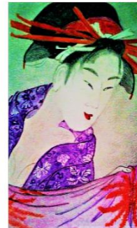
"Japan geisha" , colors pencils drawing on Steinbach paper 46/36 cm.