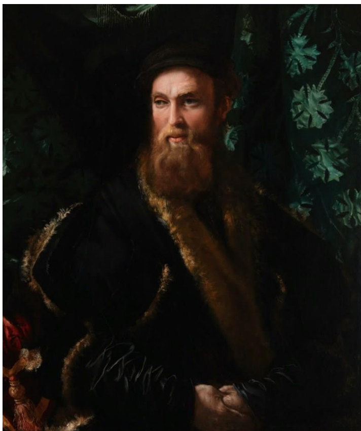
Francesco Salviati, "Bindo Altoviti" (c. 1545), oil on marble

Printr-o donație din partea regretatului binefăcător Assadour O. Tavitian, un portret din marmură renașcentistă extrem de rar a intrat în colecția MOMA (Metropolitan Museum of Art) din New York: portretul artistului roman Francesco Salviati* , din jurul anului 1545, care îl înfățișează pe bogatul bancher italian Bindo Altoviti , un dușman al puternicei familii Medici.