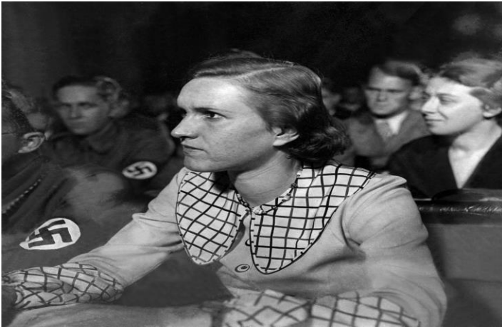
O studentă la Universitatea din Marburg, 1935.

început ca prelegeri, monografiile și articole științifice. A început în cântecele frăților studențești. Cu o viteză extraordinară după 1933, însă, a trecut la comportament: mai întâi, la o discriminare pseudo-juridică sistematică și, în cele din urmă, la un program de genocid tehnocratic.