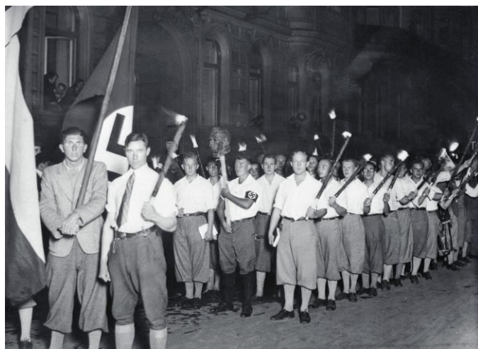
Studentii ai Universității din Berlin sosesc la un miting de ardere a cărților, 1933.

calculat că, până în 1951, beneficiul economic al uciderii a 70.273 de pacienți cu boli mintale - presupunând o cheltuială zilnică medie de 3,50 Reichsmark și o speranță de viață de zece ani - ar fi de 885.439.800 Reichsmark. Mulți istorici nu au fost cu mult mai buni, producând justificări istorice tendențioase pentru revendicările teritoriale germane din Europa de Est, care implicau deplasări masive de populație, dacă nu chiar genocid.