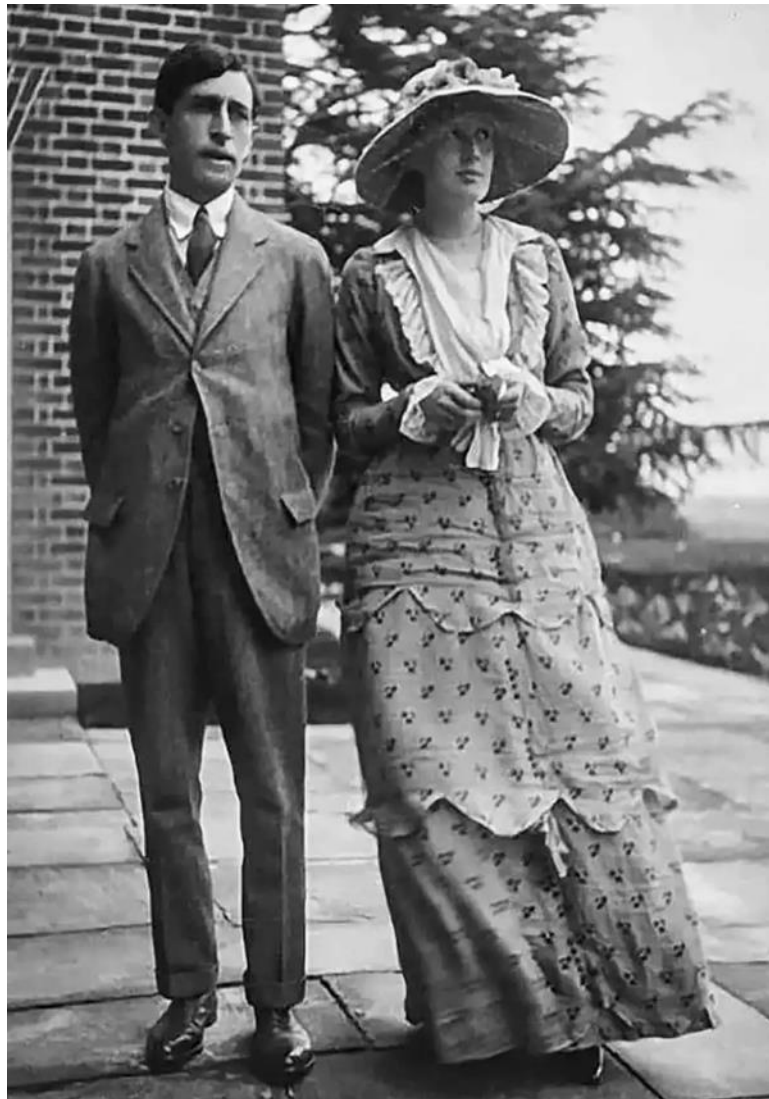
Leonard și Virginia Woolf

După o săptămână în care savurat Rembrandts și Vermeer și vremea frumoasă în Olanda, familia Woolf a ajuns la granița cu Germania. În fața lor treceau camioane cu zvastici. S-au oprit. Leonard a dispărut în vamă. Virginia a rămas în mașină, încercând să-l citească pe D.H. Lawrence în timp ce tremura de minutele care treceau - dura mult mai mult decât la granița olandeză. Ea scrie în jurnalul ei: