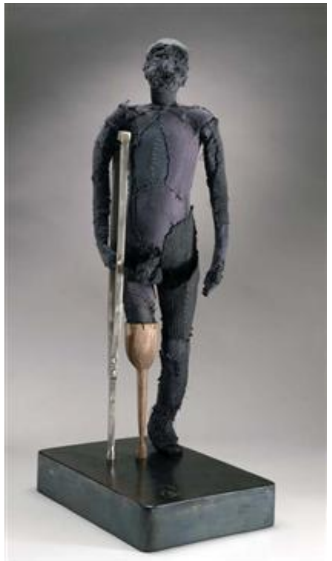
Traducere AG Saga 2023