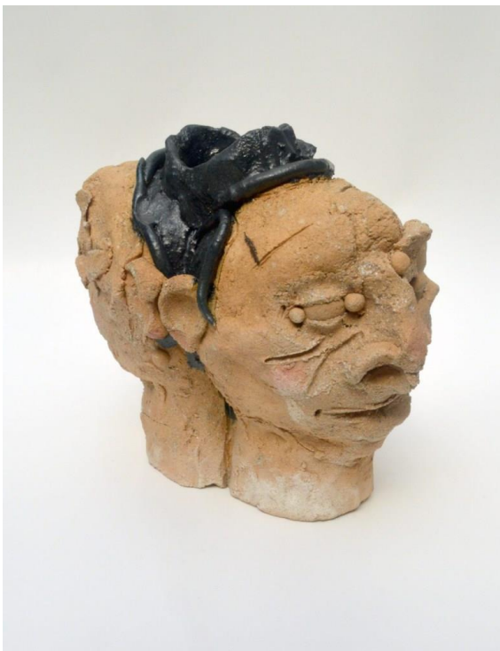
Nicki Green, "Androgyne Study 6" (2022), gresie

"Deoarece particulele de lut sunt atât de mici și de strânse, ele primesc amprentele noastre și forma corpului nostru într-un mod foarte direct și devin aproape o mărturie a atingerii de mâna omului",