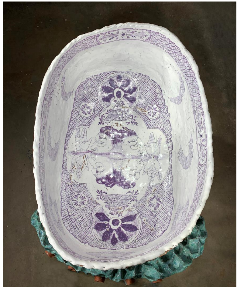
Detail of Nicki Green, "The Porous Sea (Tub)" (2019)

O mare parte din religia evreiască celebrează frumusețea tranzițiilor: între sacru și laic, între curat și necurat, între o stare de a fi și următoarea. La fel ca havdalah, aceste tranziții sunt adesea marcate de ceremonii care sunt impregnate de materializare: vederea, sunetul, mirosul, gustul și atingerea lucrurilor pe care le găsim frumoase.