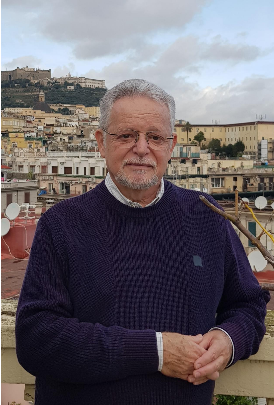
Autor - Alfred-Rennert Poplinger