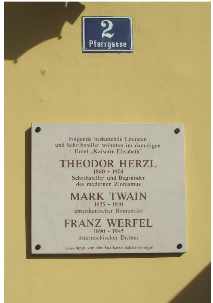
Bad Ischl – Hotelul Elizabeth

Acest hotel situat în centrul orașului Bad Ischl a gazduit în secolul XX pe cei trei oameni de seamă al căror nume e gravat pe o placă de marmură fixată la intrarea în hotel.