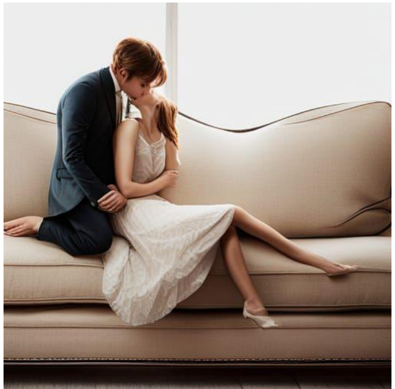
They kiss on a couch

M-am hotărât! Voi opri timpul in luna Mai Nimic nou in asta. Am mai oprit timpul Atunci când l-am văzut Obosit Împotmolit in sinapsele poetilor cu acte, aia de curte... Sau Pierdut prin buzunarele celor care așteaptă recunoștință de la vreun iubit..... Și chiar timpul ars pe rugul prostiei il voi opri chiar dacă jignește pe unul sau pe altul.