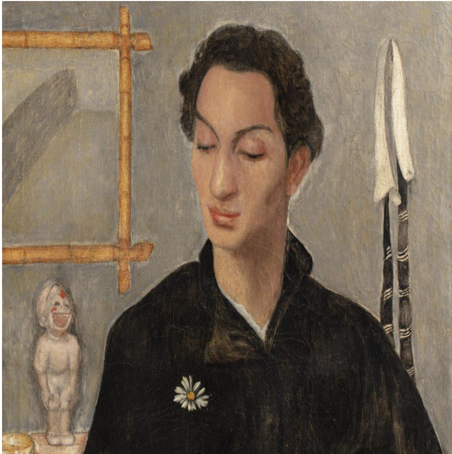
Arcadie Lochakow, Le poète David Knout Paris (1923). The painting was bought by the Museum of Jewish Art and History in Paris in 2020.

Un depozit de 48 de opere de artă care au fost descoperite în circumstanțe extrem de misterioase în 2022 vor călători la noua lor casă, la Muzeul de Artă și Istorie Evreiască din Paris. Descoperirea lor întâmplătoare a scos la lumină opera artistului Ary Arcadie Lochakow, care a murit din cauza malnutriției în 1941, după ce a fost forțat să se ascundă într-un ghetou evreiesc din Franța ocupată de naziști.