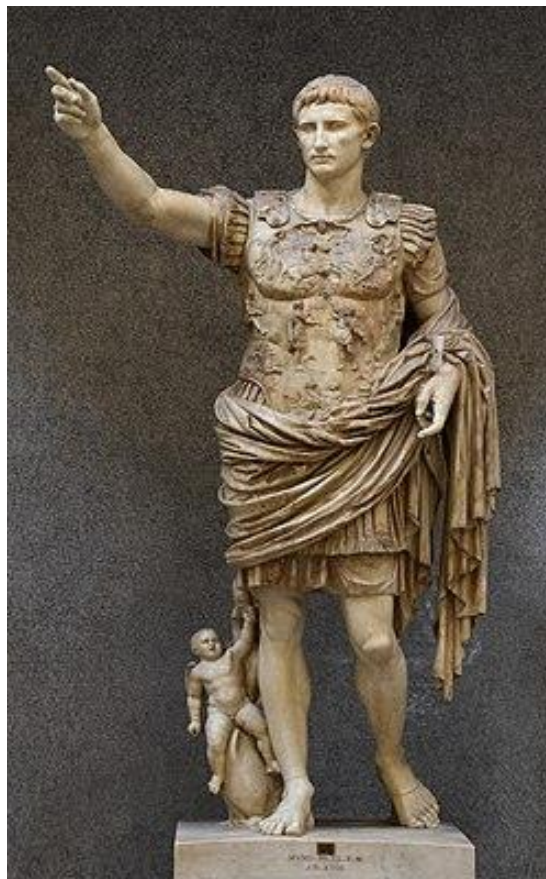
Gaius Iulius Caesar Primul împărat

Dar cea mai revelatoare dintre toate a fost gluma despre faptul că "și-a jucat rolul în comedia vieții", subliniată de aluzia teatrală la faptul că piesa de teatru a mers bine. Ne spune atât de multe despre autocrația romană faptul că se spune că părintele fondator al sistemului imperial, unul dintre primii împărați deveniți zei, și-a rezumat cariera la o piesă de teatru, la un act. ♦