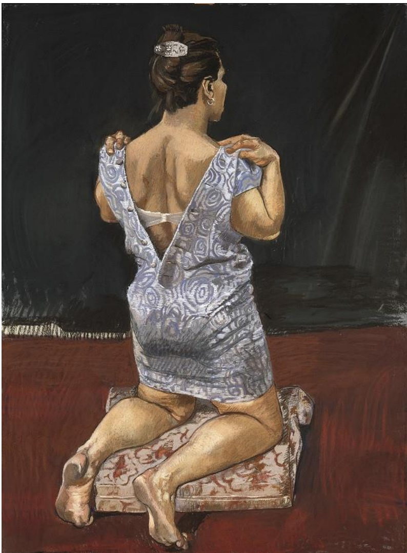
Target -1995 pastel

Prin intermediul picturilor, pastelurilor (tehnica ei preferată) sau al gravurilor, Paula Rego evocă lumea noastră. Există referiri frecvente la război, suferință, dominație, avort, viol și chiar excizie. O viziune întunecată a umanității, îndulcită ici și colo de câteva tușe de umor (Iepurașul însărcinat care povestește pățania părinților săi) sau de o notă de tandrețe, atunci când artista o reprezintă pe mama sa ca pe o varză în "Varza care plânge".