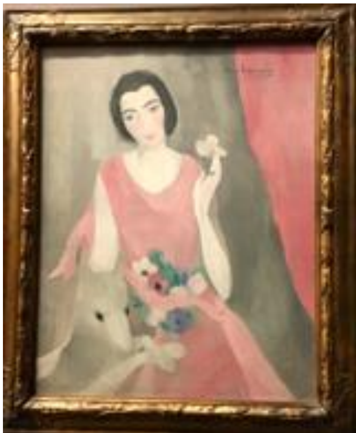
Marie Laurencin- soția lui Paul