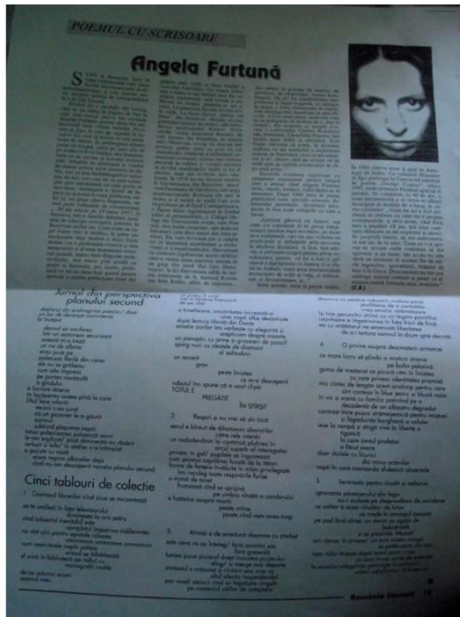
2. Angela Furtuna Debut Pagina Poemul cu Scrisoare Romania literara Nr. 46 din 1997 A

SE ÎMPLINESC 160 de ani de la nașterea lui Aron Densusianu, poet, traducător și critic, (19 nov. 1837 - 2 sept. 1900), primul autor al unei istorii a limbii și literaturii române (ed. I 1885, ed. II 1894), astăzi uitată, ca și articolele din Cercetări literare (1887). Celebritatea lui Aron Densusianu a fost una negativă: el se numără printre victimele executiei lui Maiorescu din În lături! și printre denigratorii lui Eminescu. Nu se poate face nimic pentru poetul Horelor otelite sau al Negriodei , una din